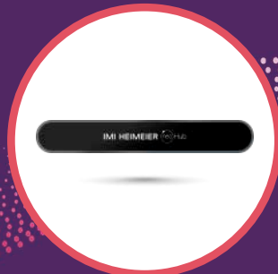
neoHub Smart Gateway (3. Generation)