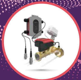
TA-Smart-Dp + TA-Sense-Dp